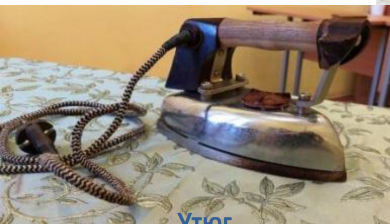
Утюг промышленный портновский