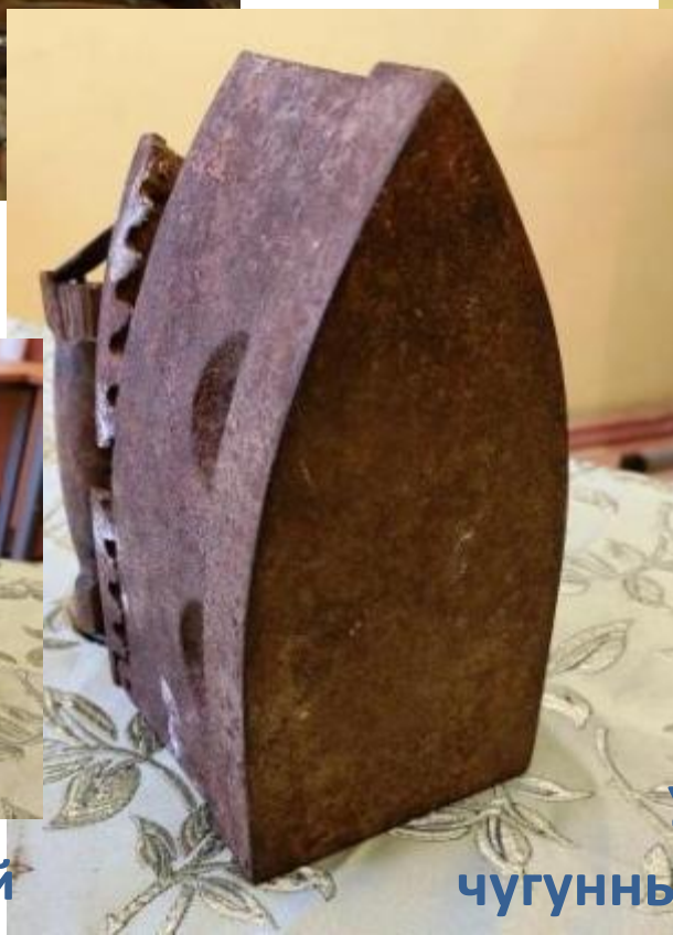
Утюг чугунный угольный