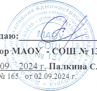
ГРАФИК ОРГАНИЗОВАННОГО ПИТАНИЯ УЧАЩИМИСЯ

на первое полугодие 2024 - 2025 учебный год